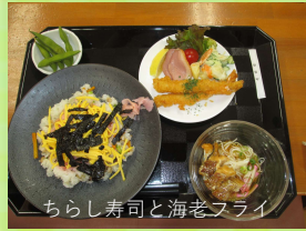
ちらし寿司と海老スライ