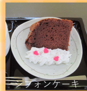
ショフォンケーキ