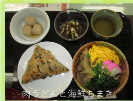
肉うどんと海鮮ちまき