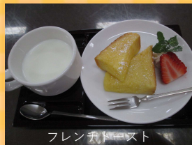
フレンチトースト